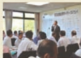
ゴルフ大会表彰式▲

・第2回の優勝組合は四国遊商、2位は中国遊商。前回同様、財団法人自動車事故被害者援護財団に寄付が行われた。