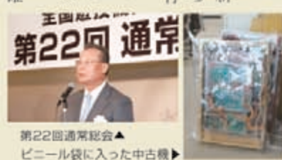
第22回通常委員会 ビニール袋に入った中古機