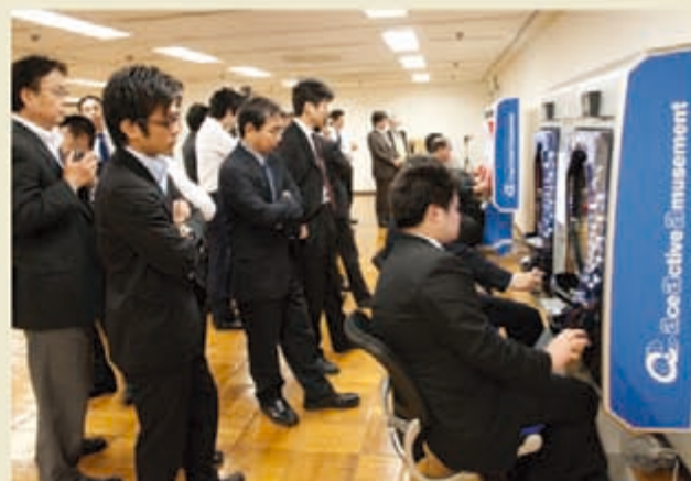
昨年5月20日、日遊協 遊技機開発委員会は、会員各社を対象に遊技機メーカーの協力で試作したCRAA機の展示・試打会を開催した

日に東京都墨田区のすみだ産業会館サンライズホールにてパチンコを休止している人及び止めようとしているファンを対象としたCRAA機の試打会を開催するとし、アンケートやヒアリング調査を実施。結果をメーカー、ホールにフィードバックする予定とした。