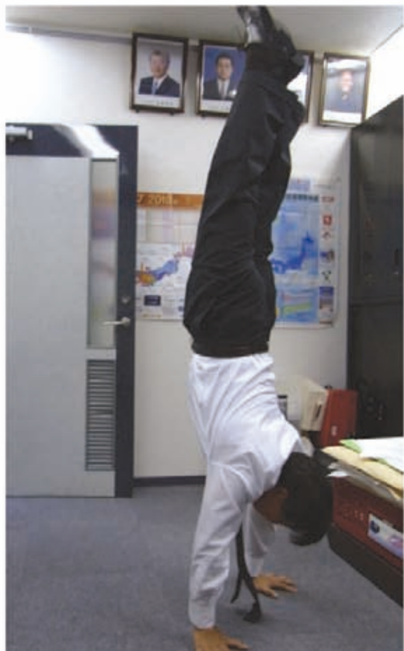
器械体操の選手だったので、今でも倒立はお手のもの

ホールの店舗数が年々減少する中でも、中古機流通は右肩上がり成長を続けてきた。全商協が発給する確認証紙は、平成21年度は