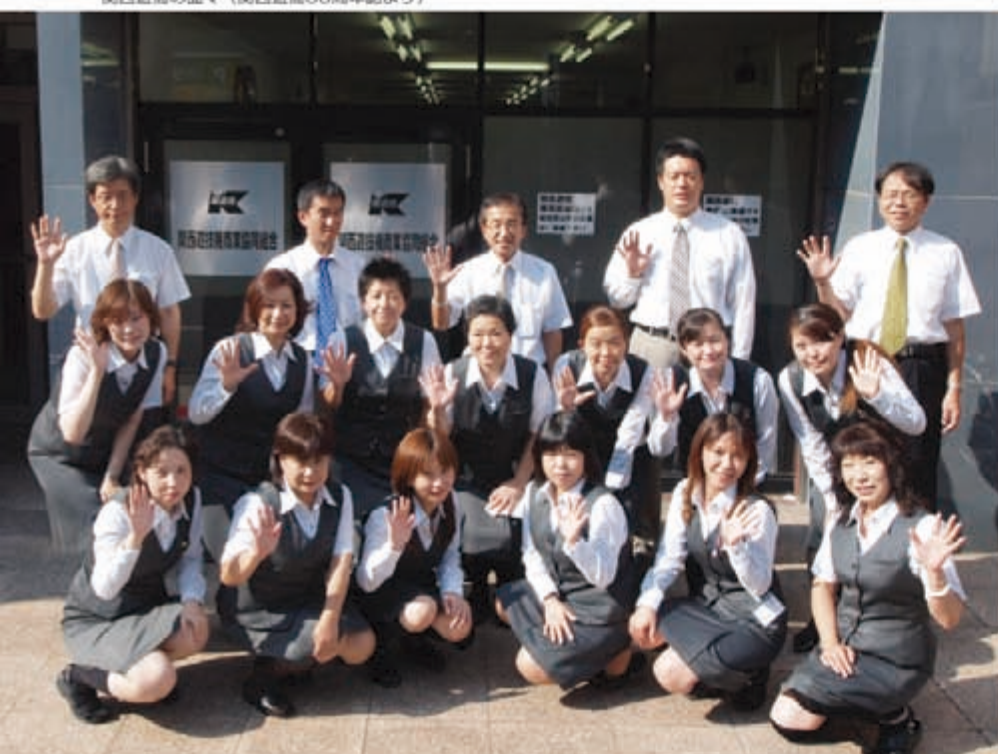
関西遊技機の面々 (関西遊技機50周年誌より)