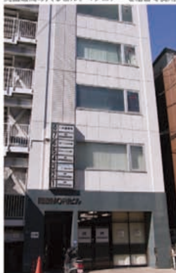
関西遊商の入るビル。4フロアを組合で使用

自分の性格は自分が良く知っている。どちらかと言うとのめりこむタイプ。競馬は初めてのボーナスを全部突っ込んで、それ以来やってません。パチンコも好きでしたが、25年ほど前、1日10万円使ったら止めと決めて、負け。それ以来やってません。