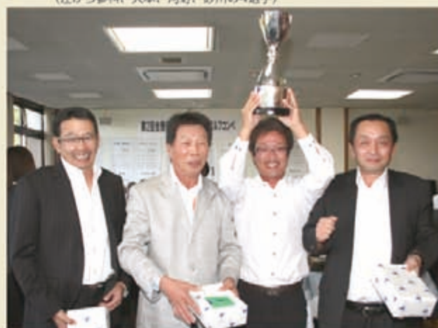
2回 全商協会会長杯チャリティーゴルフ

第2位には初代チャンピオン、中国遊商の「中国・選抜A」チームがつけた。3位には関西遊商の「タイガース」が入った。