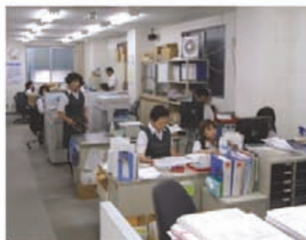
関西遊技機 1階事務所