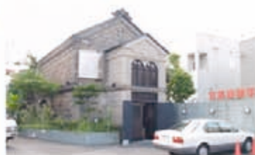
目印の「宮越屋珈琲店」