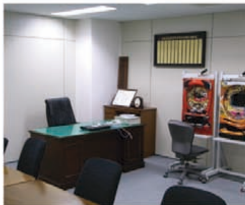
理事長室兼会議室

ればならない。そのための組織ができていなかった。責任感があって、仕事ができ、気がきいて、いざとなった時の抑えが効くという点で緒方さんを課長に推薦した」と振り返る。